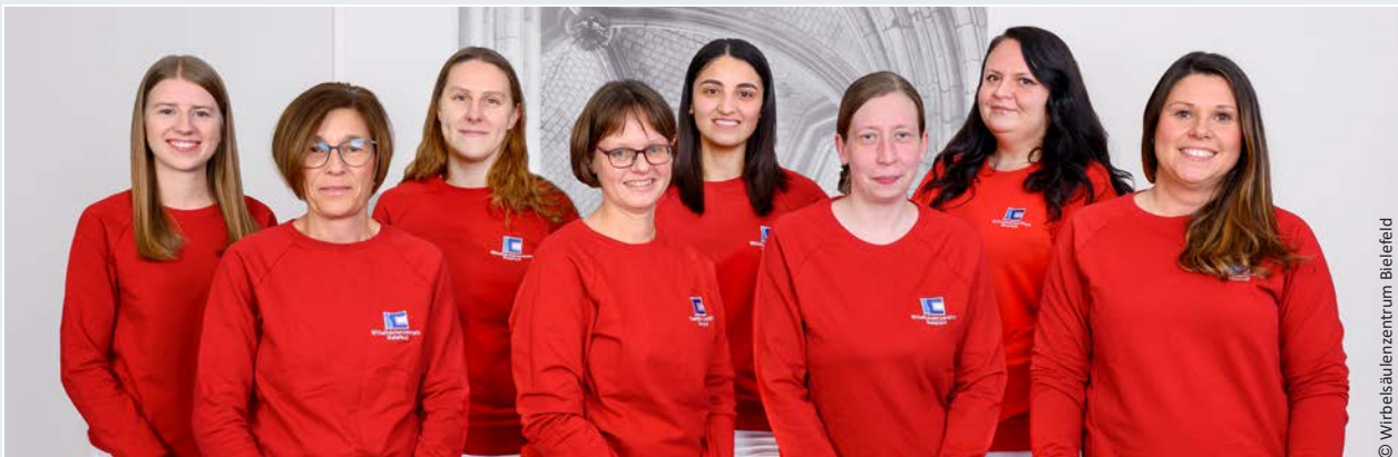
Team des Wirbelsäulenzentrums Bielefeld

In dem Bestreben einer umfassenden, interdisziplinären Patientenversorgung kooperiert das Wirbelsäulenzentrum mit dem Klinikum Bielefeld. Dieses setzt bereits seit einigen Jahren auf die indicda Sprachlösungen von DFC-SYSTEMS und die Ärzte sind hochzufrieden damit. So kam es, dass sich auch das Wirbelsäulenzentrum Bielefeld für die indicda Sprachlösungen interessierte.