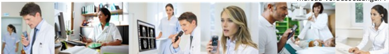
indicda Voraussetzungen 7