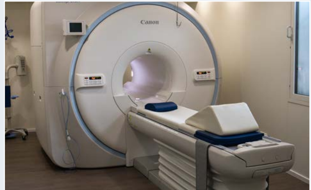
Magnetresonanztomograph in der Radiologie Falkensee

Die Radiologie Falkensee nutzt den Standardwortschatz (Topic) für Radiologie der indicda Spracherkennung, der für den Einsatz in der Praxis nochmals zusätzlich um kundenspezifische Wendungen und Akronyme parametrisiert wurde. „Der Wortschatz, den wir mit der Implementierung bekommen haben, war so gut, dass wir