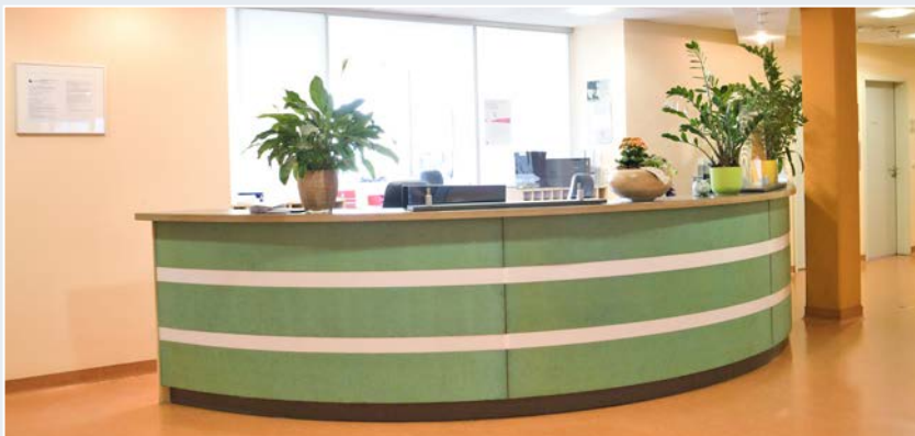
Radiologie Falkensee, Brandenburg

Die Wahl fiel schließlich auf indicda von DFC-SYSTEMS. „Das System wurde uns empfohlen. Wir haben es uns daraufhin intensiv angesehen und waren mit dem Konzept äußerst zufrieden. Auch der Prozess der Updates hat mich überzeugt. Bis heute können wir sagen, dass die Entscheidung für das System die richtige war.“