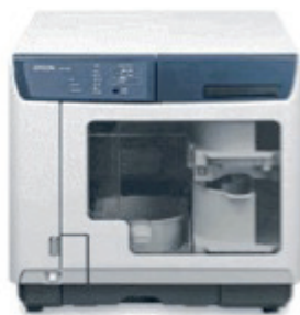
Epson Discproducer™ PP-100N mit Ethernet-Netzwerkschnittstelle